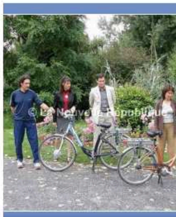
Présentation des deux nouvelles machines.

La mairie espère ainsi intéresser les Mignannois et les associations à ce mode de déplacement pour de courts trajets, mettant l'accent sur une mobilité sans aucune émission de CO2.